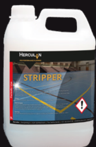
Stripper Proporción de mezcla 1:100