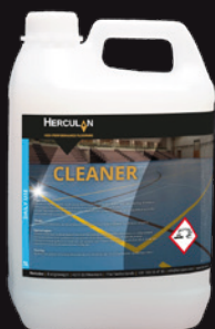
Cleaner Proporción de mezcla 1:100