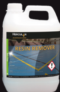
Resin Remover Proporción de mezcla 0,8:100